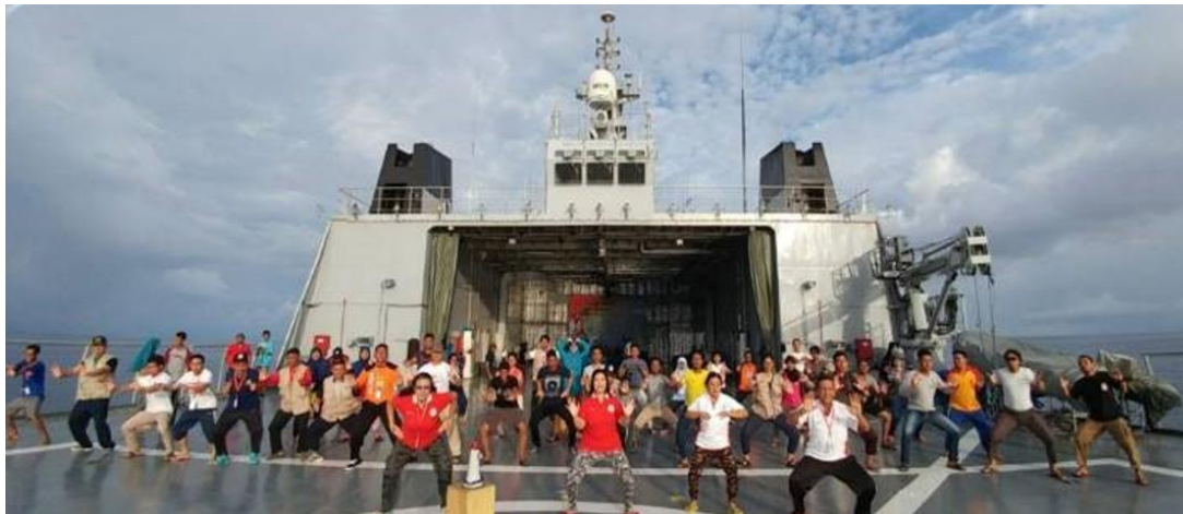
Sail to Merauke 2017 : Latihan BEP diatas kapal