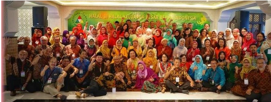
Halal Bi Halal BEPers di Jakarta 2017