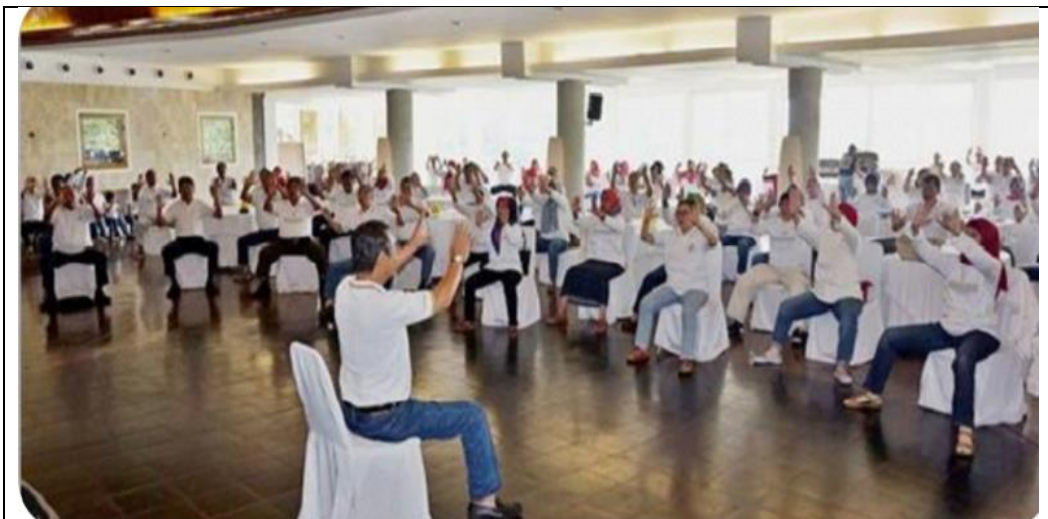
Latgabnas – 2 di Bandung 2016