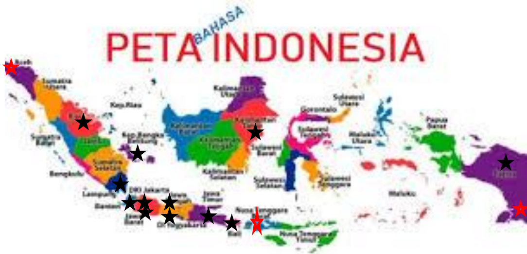
Gambar 2 Peta Sebaran di Indonesia

★ Sudah ada pengurus wilayahnya : Riau, Babel, Lampung, Banten, DKI Jakarta, Jabar, Jateng, D.I. Yogyakarta, Jatim, Bali, Kaltim, dan Papua. (12 propinsi)