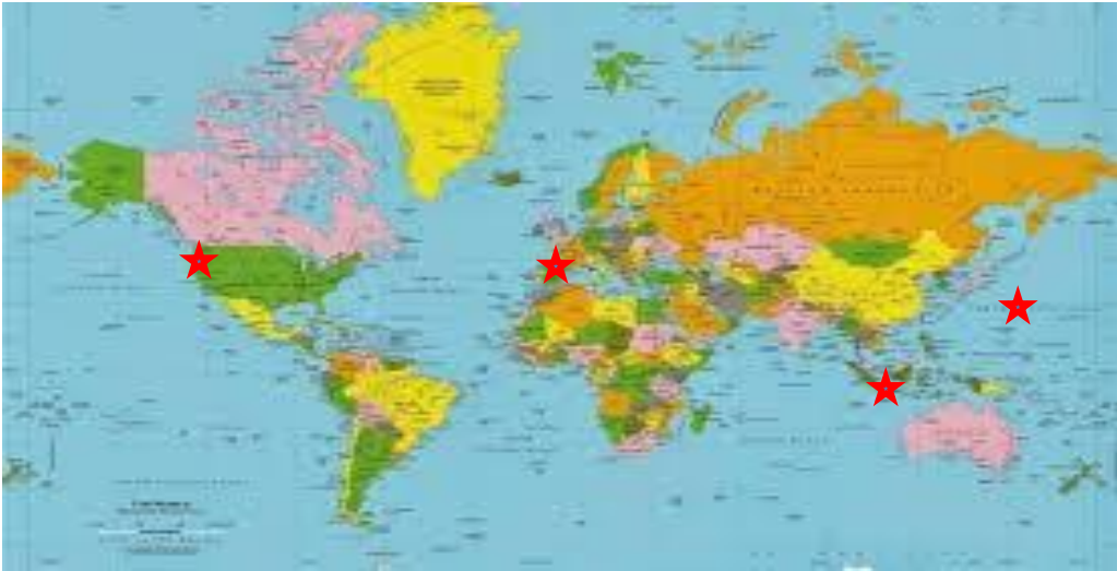
Gambar 1 Peta Sebaran di Dunia

★ Singapore, Amerika Serikat, Jepang dan Inggris.